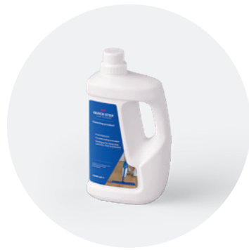
Reinigingsmiddel 1 l of 2,5 l QSCLEANING1000 QSCLEANING2500

Dit reinigingsmiddel is speciaal ontwikkeld voor Quick-Step-vloeren. Het reinigt het oppervlak grondig en behoudt het originele uitzicht, zodat je extra lang van je nieuwe vloer kunt blijven genieten.