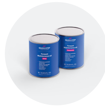
Onderhoudsolie 1 l QSWMAINTOILN / QSWMAINTOILW

Met deze set kun je eenvoudig lichte beschadigingen herstellen en de oorspronkelijke kleur van je vloer weer herstellen. Voor gedetailleerde stapsgewijze instructies, zie quickstep.com .